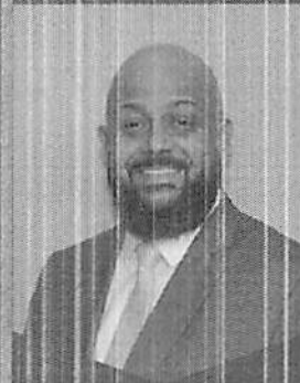
Paulo Alves Presidente da Companhia Brasileira de Governança