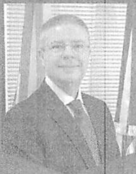
Antonio Anastasia Ministro do TCU