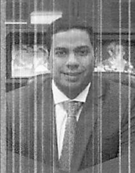
Jonathan de Jesus Ministro do TCU